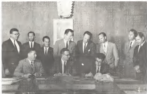
Firmamento di e acto notarial dia 18 di maart 1968, unda Bestuurscollege a pasa un pida tereno di 13000 m2 pa Aruba Real Estate N.V.

Riba e grafico aki nos ta mira e diferente personan den realizacion di e projecto aki.